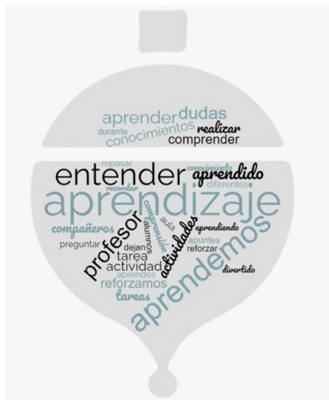
Figura 4: Nube de palabras.