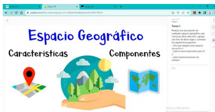
Figura 2: Ejemplo sobre el uso del muro virtual.